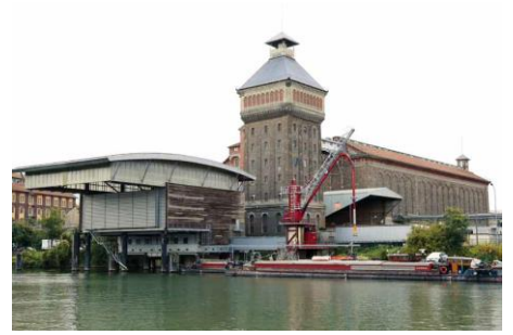
© Maison de Banlieue et de l'Architecture