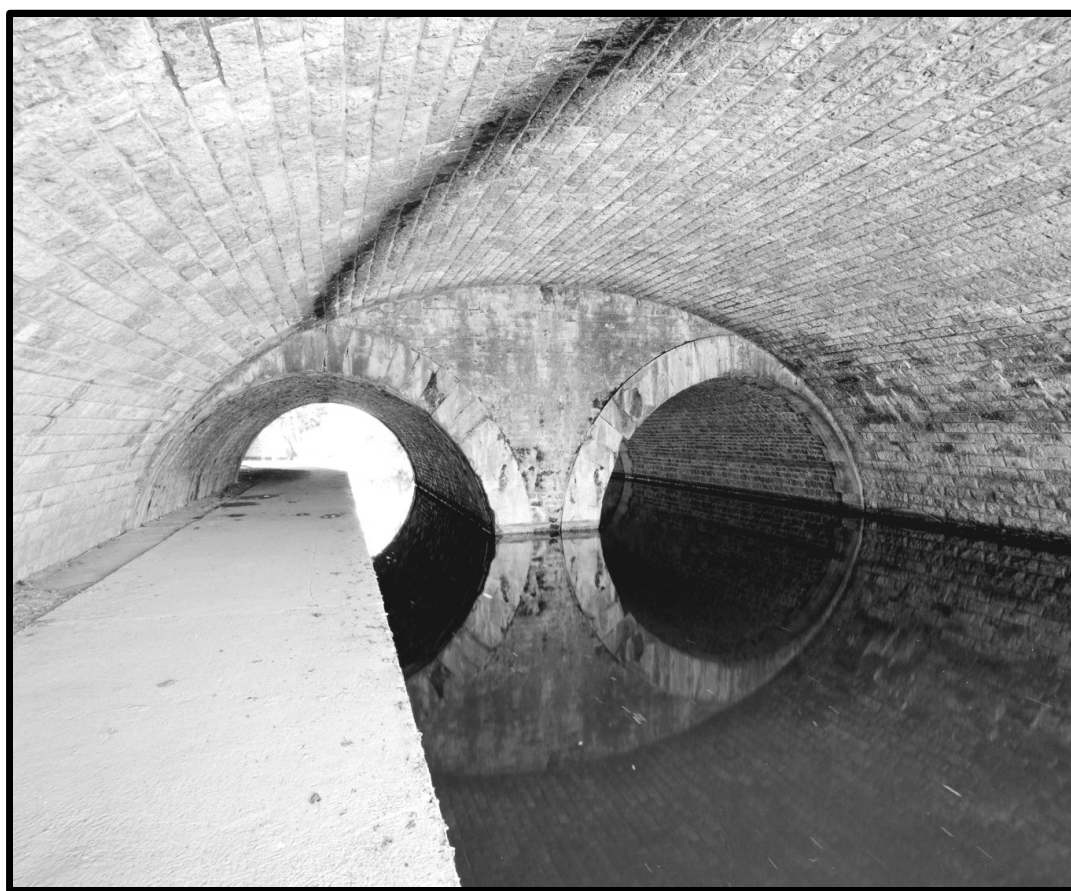
Athis-Mons, pont de chemin de fer sur l'Orge.

RdV à la Maison de Banlieue et de l'Architecture à 20h30. Gratuit, sur inscription. Prévoir une lampe de poche.