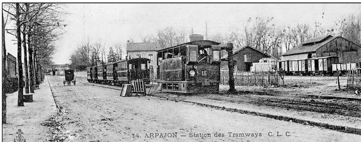
La gare d'Arpajon, terminus du tramway. Carte postale, vers 1900.

Un film de Christophe Ramage, durée : 52 min.