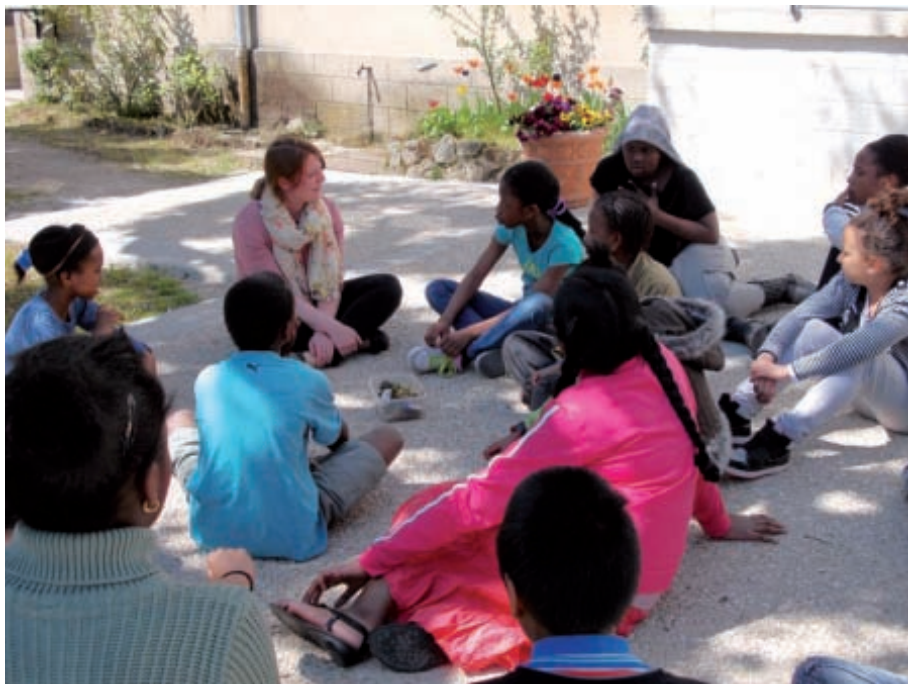
Projet Nos paysages.