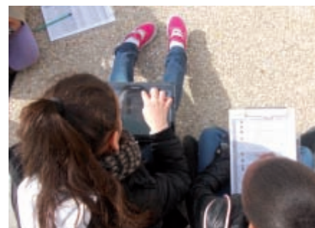
Visite avec une tablette numérique.

Les élèves enquêtent sur les différentes mairies d'Athis-Mons, de l'ancienne mairie-école au centre administratif actuel. Ils sont équipés d'une tablette numérique qui leur donne accès à des archives (plans, cartes postales, textes). Une activité pour découvrir l'histoire d'une ville de banlieue et celle des institutions républicaines.