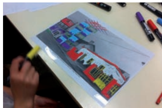
Projet Par-dessus les toits.

LA MAISON DE BANLIEUE et de l'Architecture accompagne les enfants et les élèves dans la découverte de l'environnement urbain, du patrimoine en banlieue et de l'architecture. Par un apport de connaissances et par une éducation du regard, nous les aidons à acquérir des outils de lecture de leur cadre de vie, à élargir leurs références et à développer leur esprit critique. Les enjeux : revaloriser les villes d'art Modeste et d'histoires Simples en banlieue et constituer une culture urbaine commune pour agir dans l'avenir en citoyen-citoyen.