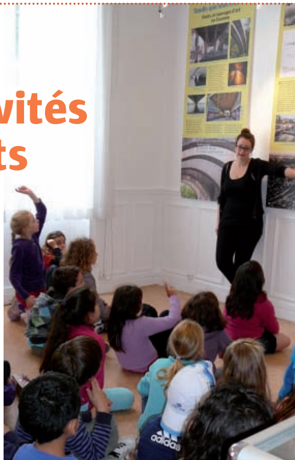
Visite de l'exposition Tandis que sous le pont.

LES ACTIVITÉS sont ajustées à l'âge du public et aux demandes des enseignants. Elles abordent de nombreux sujets en s'appuyant sur le local et en croisant les approches : histoire, géographie, histoire des arts, citoyenneté, développement durable, etc.