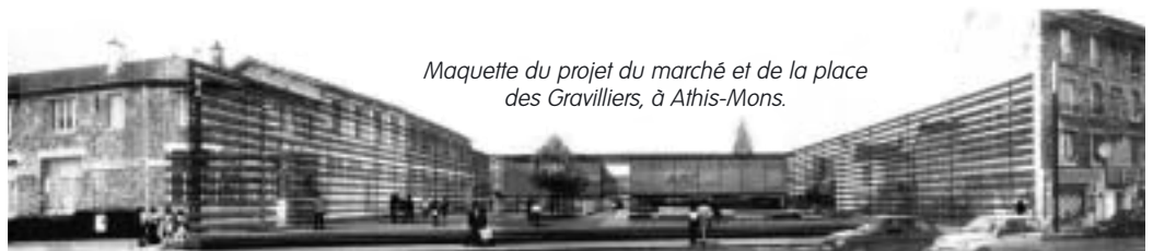
Maquette du projet du marché et de la place des Gravilliers, à Athis-Mons.