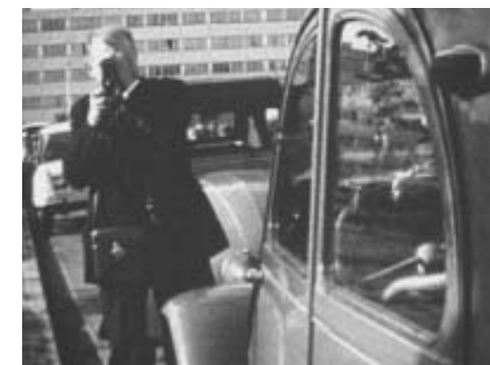
Coll. Stampfler, cité du FFF, Athis-Mons, vers 1965.

La Maison de Banlieue a réalisé, avec l'association Cinéam, ce documentaire vidéo de 30' à partir d'extraits de films amateurs (familiaux) collectés depuis un an par Marie-Catherine Delacroix. Ce cinéma amateur est le témoin de l'amélioration du niveau de vie des familles et du développement économique des Trente Glorieuses (1945-1975). Il est aussi le témoin privilégié de nos mœurs et coutumes, rituels familiaux (le jardin du pavillon, la cour de l'immeuble, les vacances en province ou au bord de la mer) ou religieux (baptême, communion, mariage, etc.), des modes vestimentaires et de l'évolution du paysage... Une heure à partager ensemble. Projection suivie d'un pot. ● Mardi 27 février 2001 à 19 h, salle Ventura, espace Jean-Monnet, rue S.-Desbordes, à Athis-Mons. Entrée libre.