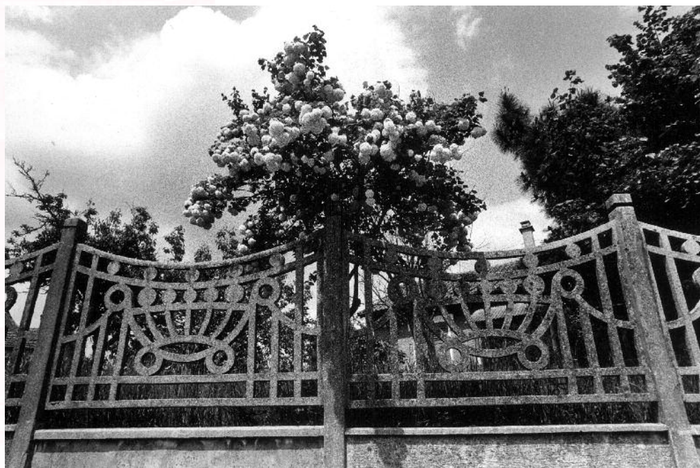
© Athis-Mons, 1984. F. Buisson, coll. MdBA.

Activités Projection, conférence, visites de sites et randonnée urbaine