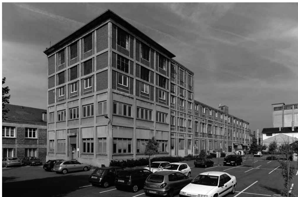
Ex-entreprise Sanders, Athis-Mons

Cette exposition est accompagnée du Dossier n°4 de la Maison de Banlieue et de l'Architecture (« Aux fours et aux moulins »). Plein tarif : 2 € tarif adhérent : 1 €.