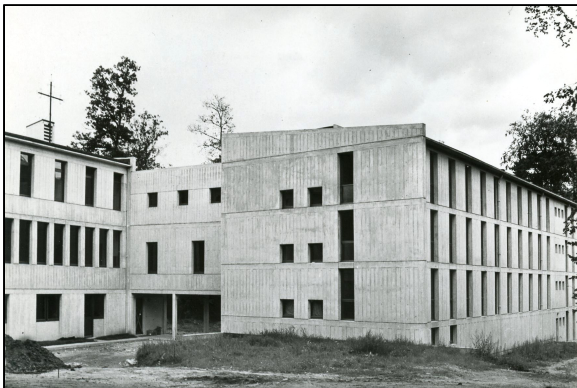
Couvent de la Clarté-Dieu, les bâtiments conventuels, années 1960. CP, coll. France-Barbou.