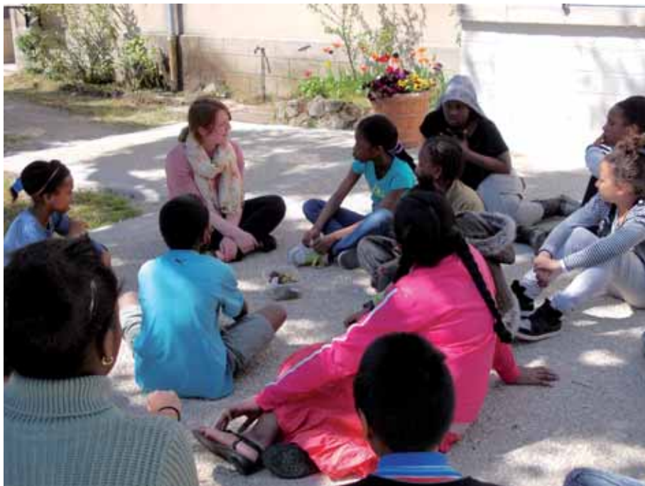
Projet Nos paysages.