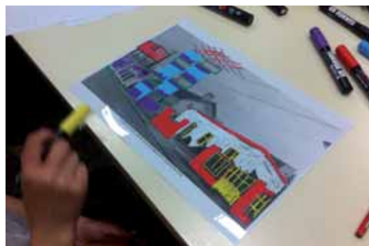
Projet Par-dessus les toits.

LA MAISON DE BANLIEUE et de l'Architecture accompagne les enfants et les élèves dans la découverte de l'environnement urbain, du patrimoine en banlieue et de l'architecture. Par un apport de connaissances et par une éducation du regard, nous les aidons à acquérir des outils de lecture de leur cadre de vie, à élargir leurs références et à développer leur esprit critique. Les enjeux : revaloriser les villes d'art Modeste et d'histoires Simples en banlieue et constituer une culture urbaine commune pour agir dans l'avenir en citoyen-citoyen.