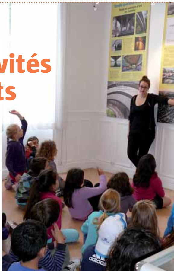
Visite de l'exposition Tandis que sous le pont.

LES ACTIVITÉS sont ajustées à l'âge du public et aux demandes des enseignants. Elles abordent de nombreux sujets en s'appuyant sur le local et en croisant les approches : histoire, géographie, histoire des arts, citoyenneté, développement durable, etc.