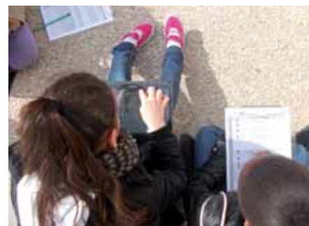
Visite avec une tablette numérique.

Les élèves enquêtent sur les différentes mairies d'Athis-Mons, de l'ancienne mairie-école au centre administratif actuel. Ils sont équipés d'une tablette numérique qui leur donne accès à des archives (plans, cartes postales, textes). Une activité pour découvrir l'histoire d'une ville de banlieue et celle des institutions républicaines.