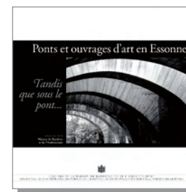
CAHIER n° 18 (2012) Tandis que sous le pont... Ponts et ouvrages d'art en Essonne