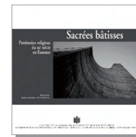
CAHIER n° 17 (2011) Sacrées bâtisses. Patrimoine religieux du xx e siècle en Essonne