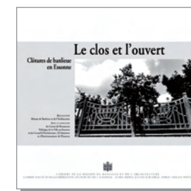
CAHIER n° 15 (2009) Le clos et l'ouvert. Clôtures de banlieue en Essonne