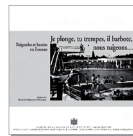
CAHIER n° 16 (2010) Je plonge, tu trempe, il barbote, nous nageons... Baignades et bassins en Essonne