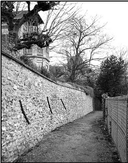
Sentier de l'Égypte, Athis-Mons