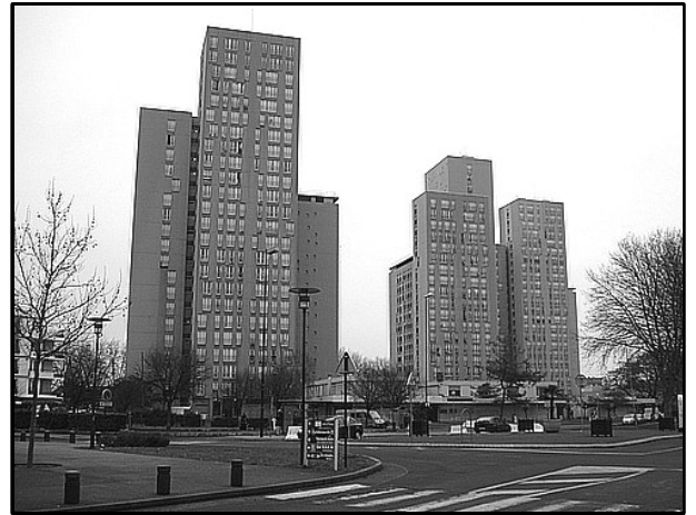
Tours de Vigneux-sur-Seine