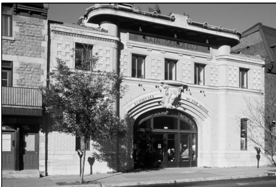
Écomusée du fier monde à Montréal (histoire industrielle et ouvrière).

Restitution du voyage d'étude au Québec : écomusées & centres d'interprétation.