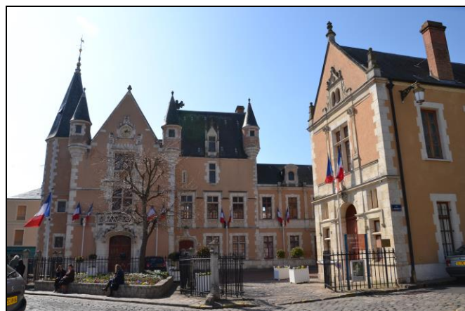
Hôtel de ville d'Étampes (XVI e et XIX e siècles). / Mairie-école d'Athis-Mons (1880).

L'exposition retrace l'épopée communale à travers des panneaux de textes illustrés (cartes postales anciennes, photographies actuelles, plans d'architectes...), trois maquettes de mairies et un film de Cinéam, réalisé à partir de films familiaux.