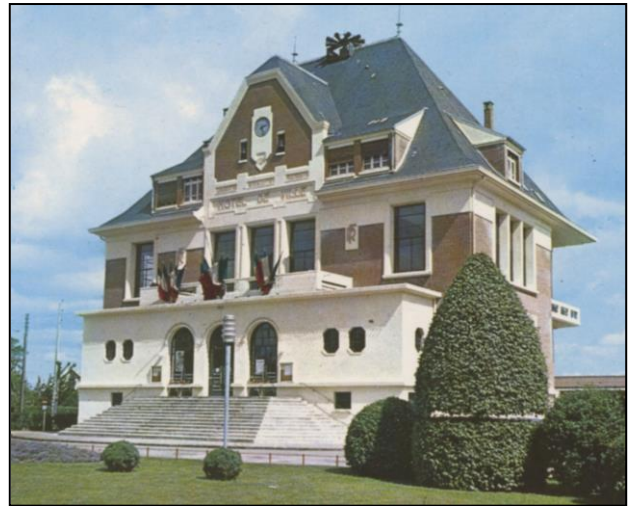
Mairie de Sainte-Geneviève-des-Bois (1935).

Tout au long du XXe siècle , avec l'explosion démographique et l'émergence de nouveaux services, les mairies de banlieue essonniennes s'agrandissent, se transforment, se déplacent. Alors que certaines municipalités s'installent dans un bâtiment préexistant, en particulier d'anciennes demeures aristocratiques ou bourgeoises (Athis-Mons, Juvisy, Draveil...), d'autres se dotent d'un édifice dans le style de l'époque (Art déco à Sainte-Geneviève-des-Bois, modernisme à Morangis).