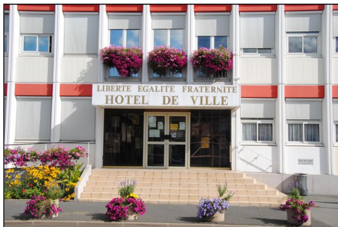
Hôtel de ville de Grigny (1971).

Comme une maison commune. Mairies et sièges d'intercommunalité en Essonne